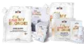
OH MY BLONDE!