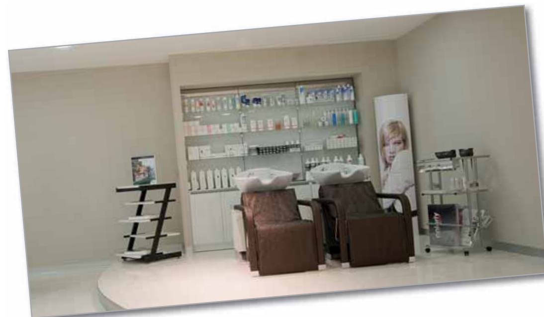
Biolife Medical & Beauty Village

Sul vostro palcoscenico, si mette in scena il talento artistico che c'è in voi... il frutto del vostro impegno, della vostra esperienza e della vostra creatività.